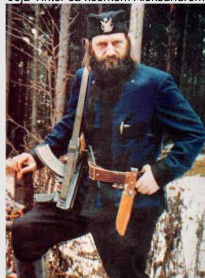
Četnik Nikola Poplašen