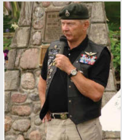
Zloglasni UN general Lewis Makenzie

29. avgusta crnogorska policija na graničnom prijelazu Dobrakovo uhapsila je državljanina Srbije zločinca Branka Vlača (58) iz Beograda, za kojim je raspisana međunarodna potjernica Interpola Sarajevo